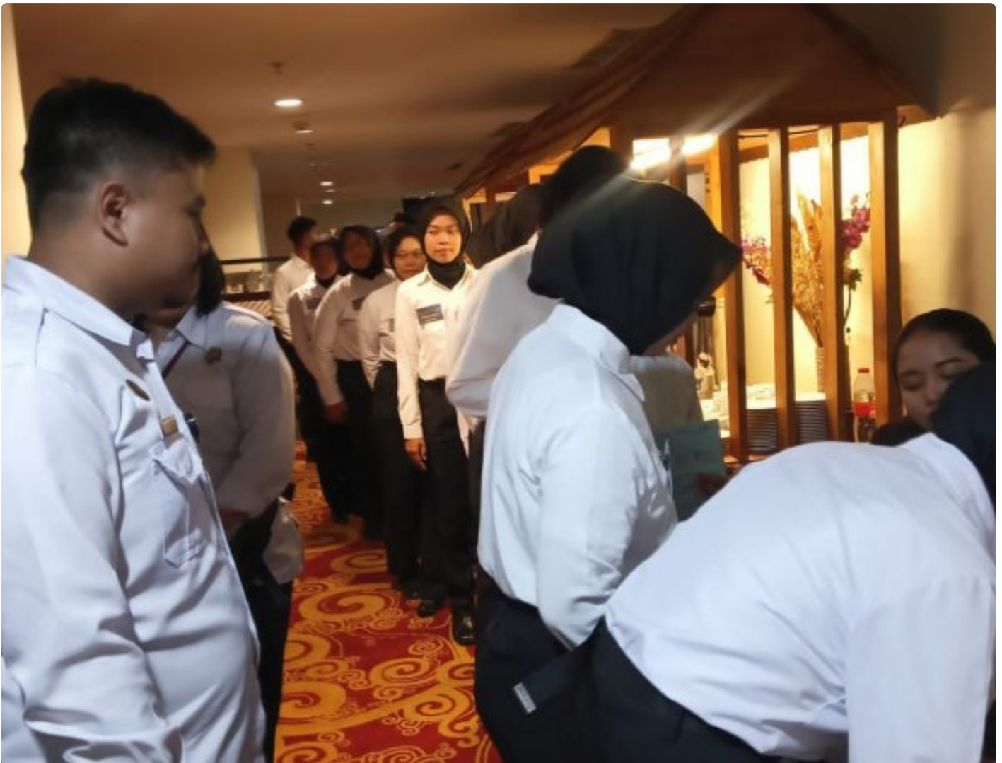
Wujud Kepedulian, Lapas Magelang Ikut Sukseskan Donor Darah HUT Ke-13 Hotel Atria

Magelang - Dalam rangka memperingati Hari Ulang Tahun Ke-13 Hotel Atria Magelang, jajaran Lembaga Pemasyarakatan (Lapas) Magelang turut ambil bagian dalam kegiatan donor darah yang digelar, pada Selasa (02/12/2025).