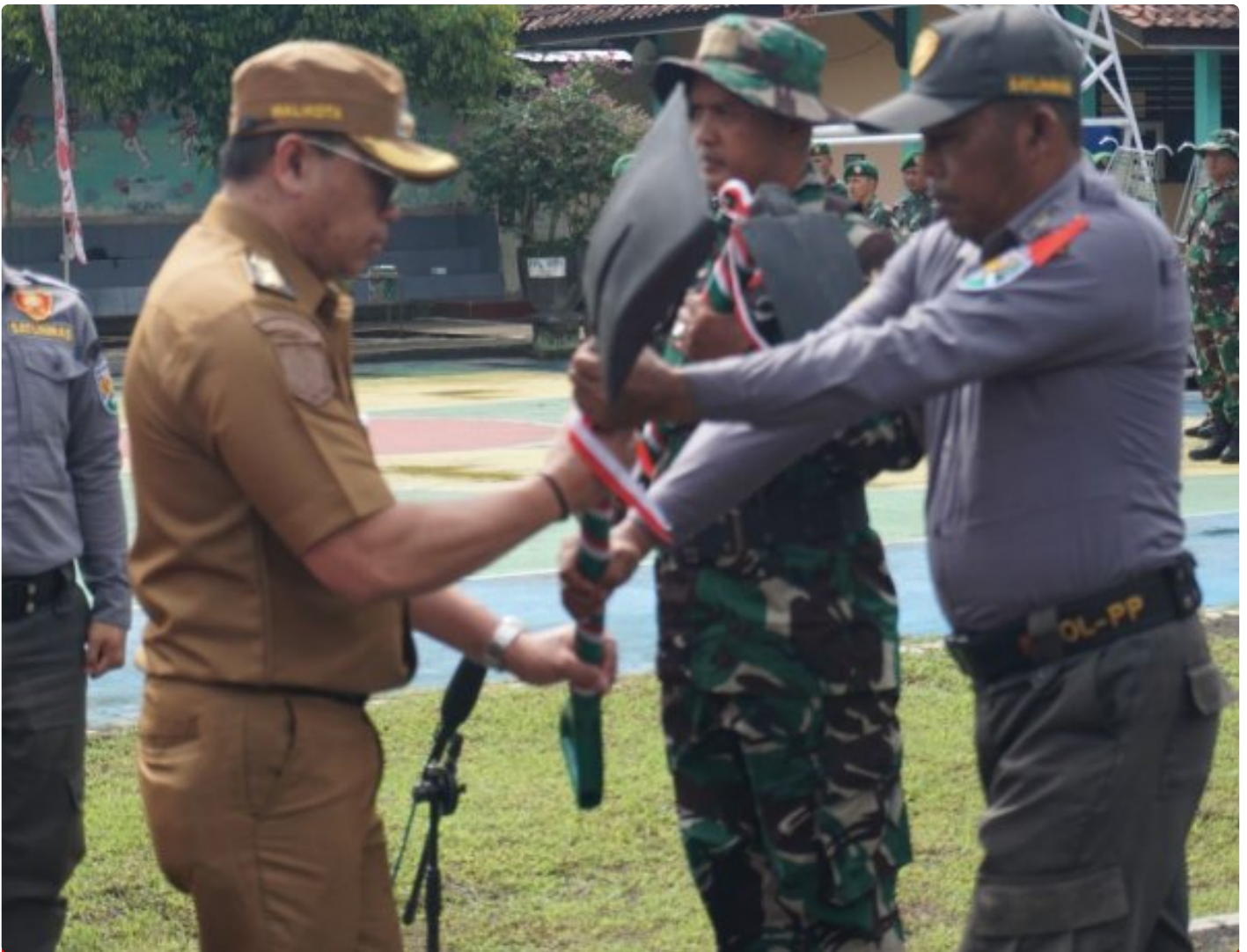
(Foto Dokumen) : Serah terima alat kerja dalam Upacara pembukaan TMMD Sengkuyung Tahap I Tahun 2026

Magelang Kota – Upacara Pembukaan TNI Manunggal Membangun Desa (TMMD) Sengkuyung Tahap I Tingkat Kota Magelang Tahun 2026 resmi digelar di wilayah Kelurahan Kedungsari, Kecamatan Magelang Utara, Kota Magelang, Selasa (10/02/2026).