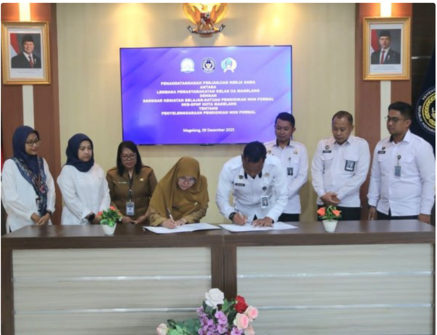
Tingkatkan Program Pembinaan WBP, Kalapas Magelang Tanda Tangan PKS Dengan SKB-SPNF

Magelang - Dalam upaya memperkuat kualitas pembinaan bagi Warga Binaan Pemasyarakatan (WBP), Kepala Lapas Kelas IIA Magelang resmi menandatangani Perjanjian Kerja Sama (PKS) dengan Sanggar Kegiatan Belajar – Satuan Pendidikan Non Formal (SKB–SPNF) Kota Magelang, Selasa