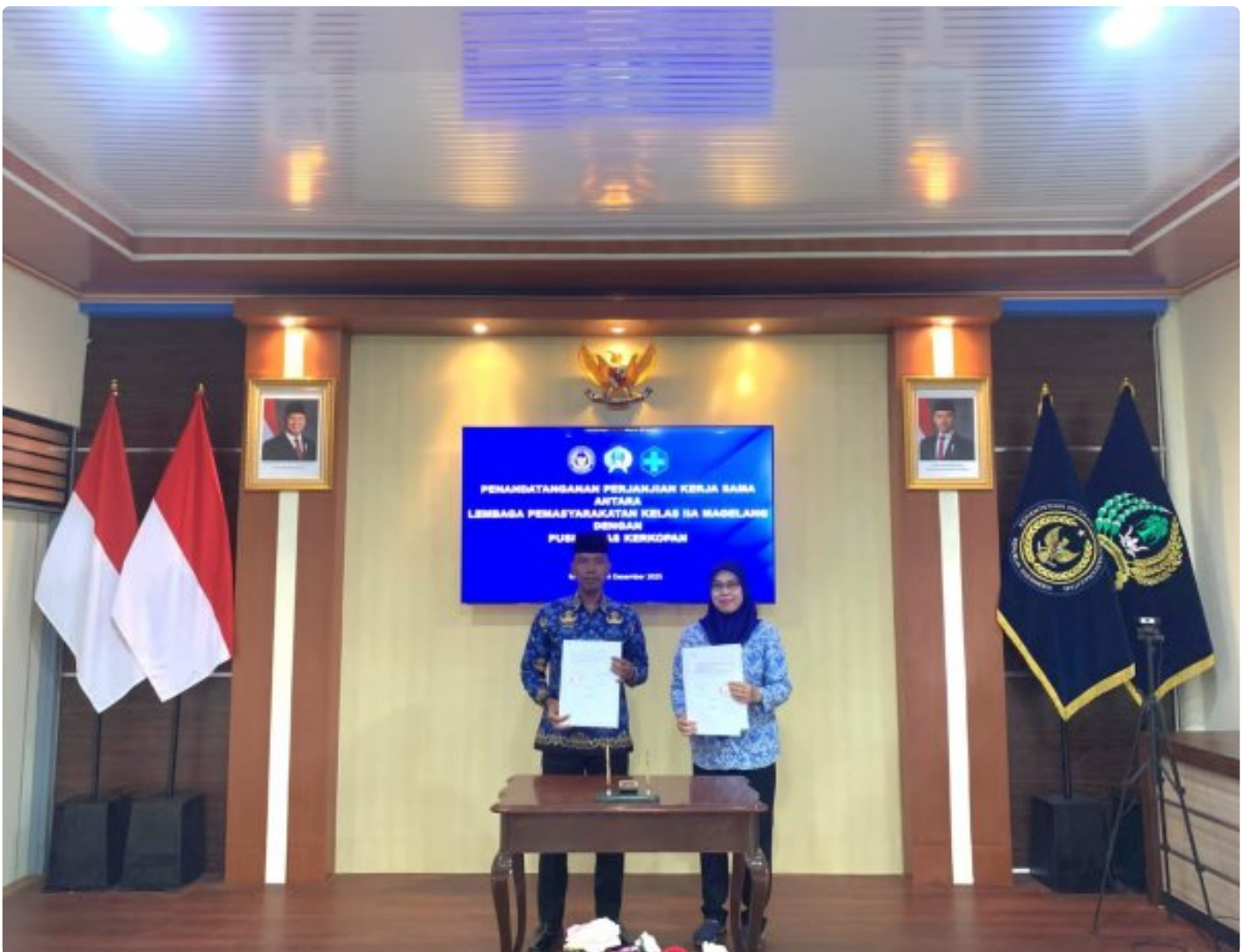
Tingkatkan Pelayanan Kesehatan Bagi WBP, Kalapas Magelang Tanda Tangan PKS Dengan Puskesmas Kerkopan

Magelang — Dalam rangka meningkatkan kualitas pelayanan kesehatan bagi Warga Binaan Pemasyarakatan (WBP), Kepala Lembaga Pemasyarakatan (Kalapas) Kelas IIA Magelang menandatangani Perjanjian Kerja Sama (PKS) dengan Puskesmas Kerkopan, Jumat 19/12/2025.