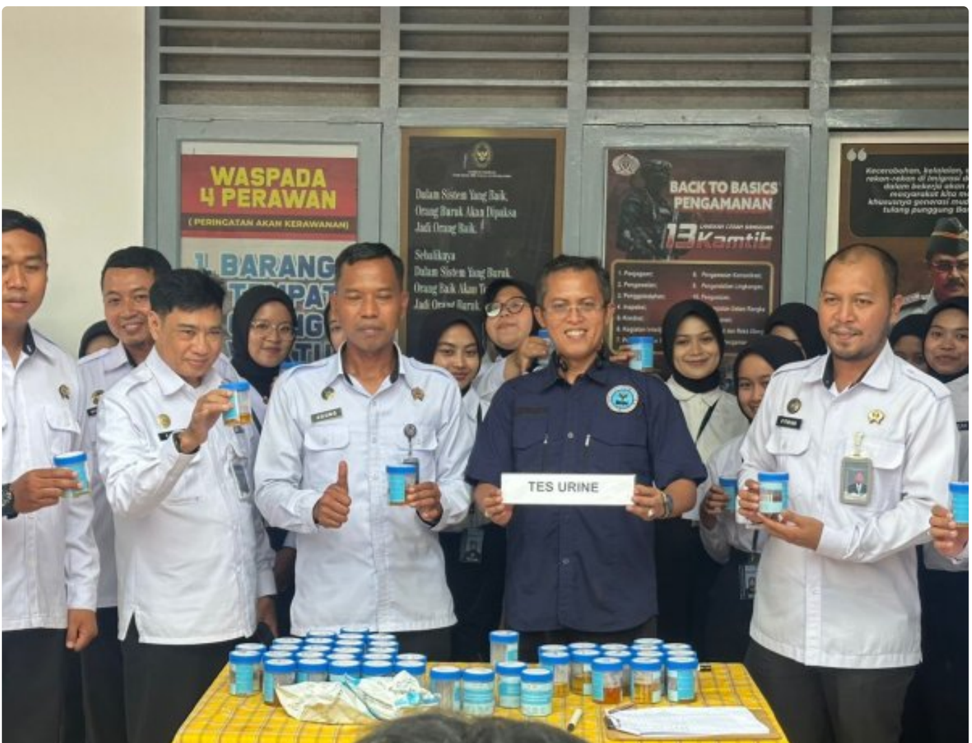
Tes urine kepada Kalapas beserta seluruh pegawai disaksikan oleh Ka.BNN Kabupaten Magelang

Magelang — Lembaga Pemasyarakatan Kelas IIA Magelang menggelar tes urine mendadak kepada Kepala Lapas beserta seluruh pegawai pada Kamis 11/12/2025.