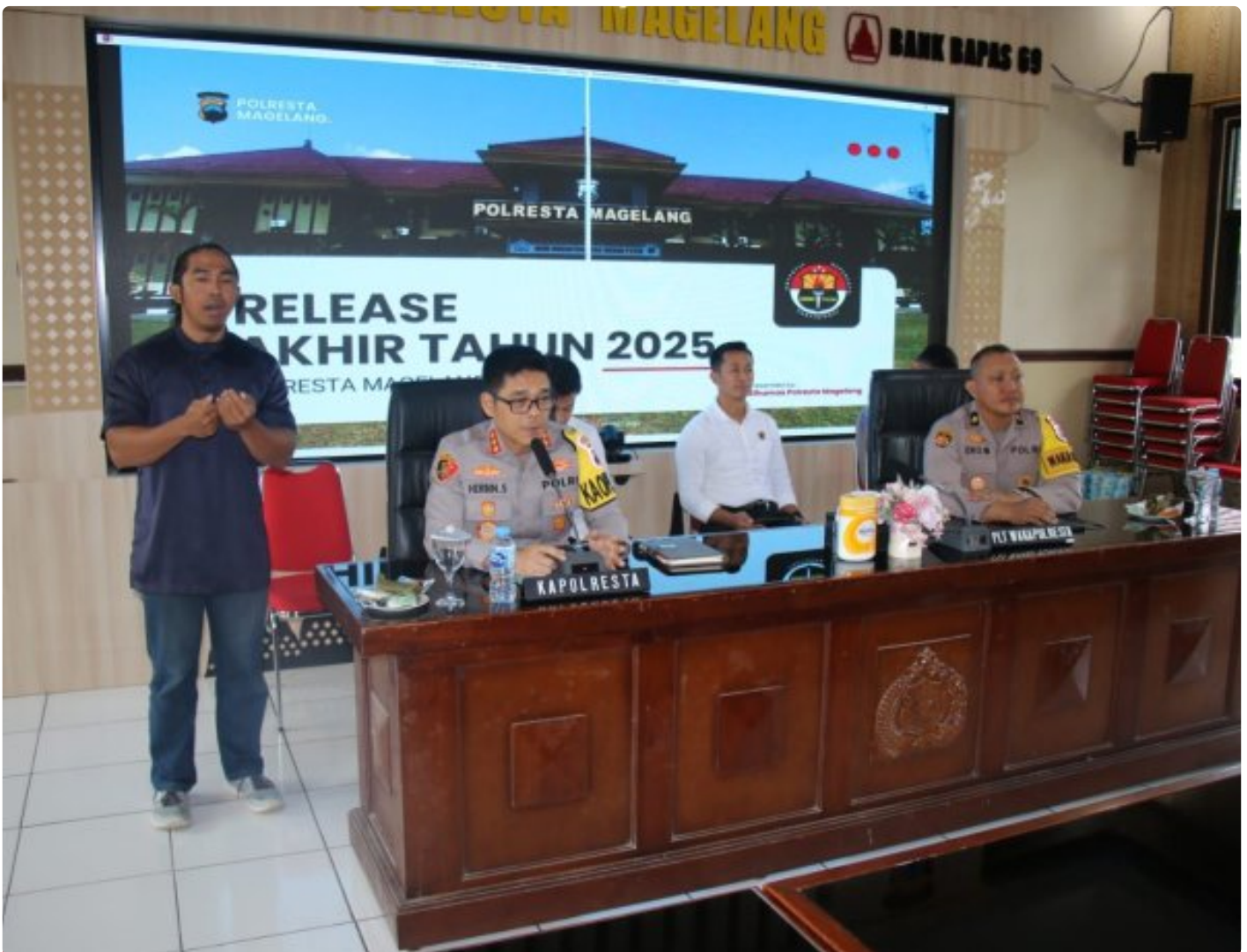
Kapolresta Magelang, Kombes Pol Herbin Sianipar secara resmi pimpin gelaran Rilis Akhir Tahun 2025 di Aula Polresta Magelang, Rabu (31/12/2025).

MAGELANG- Menyongsong lembaran baru, Polresta Magelang secara resmi menggelar Rilis Akhir Tahun 2025 di Aula Polresta Magelang, Rabu (31/12/2025). Acara ini menjadi wujud nyata komitmen kepolisian dalam menyajikan laporan kinerja yang transparan dan akuntabel kepada masyarakat luas. Kegiatan strategis ini dipimpin langsung oleh Kapolresta Magelang , Kombes