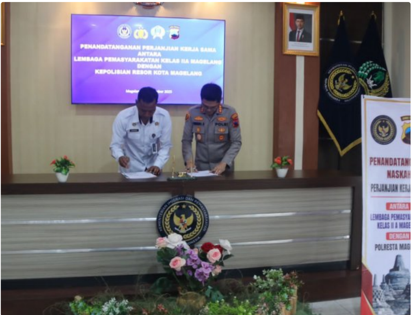
Perkuat Sinergi Antar Aparat, Kalapas dan Kapolresta Magelang Tandatangani PKS

Magelang - Kepala Lembaga Pemasyarakatan (Kalapas) Magelang bersama Kapolresta Magelang secara resmi menandatangani Perjanjian Kerja Sama (PKS) sebagai bentuk penguatan sinergi antar aparat penegak hukum, Kamis 18/12/2025 di Aula Sahardjo Lapas Magelang.