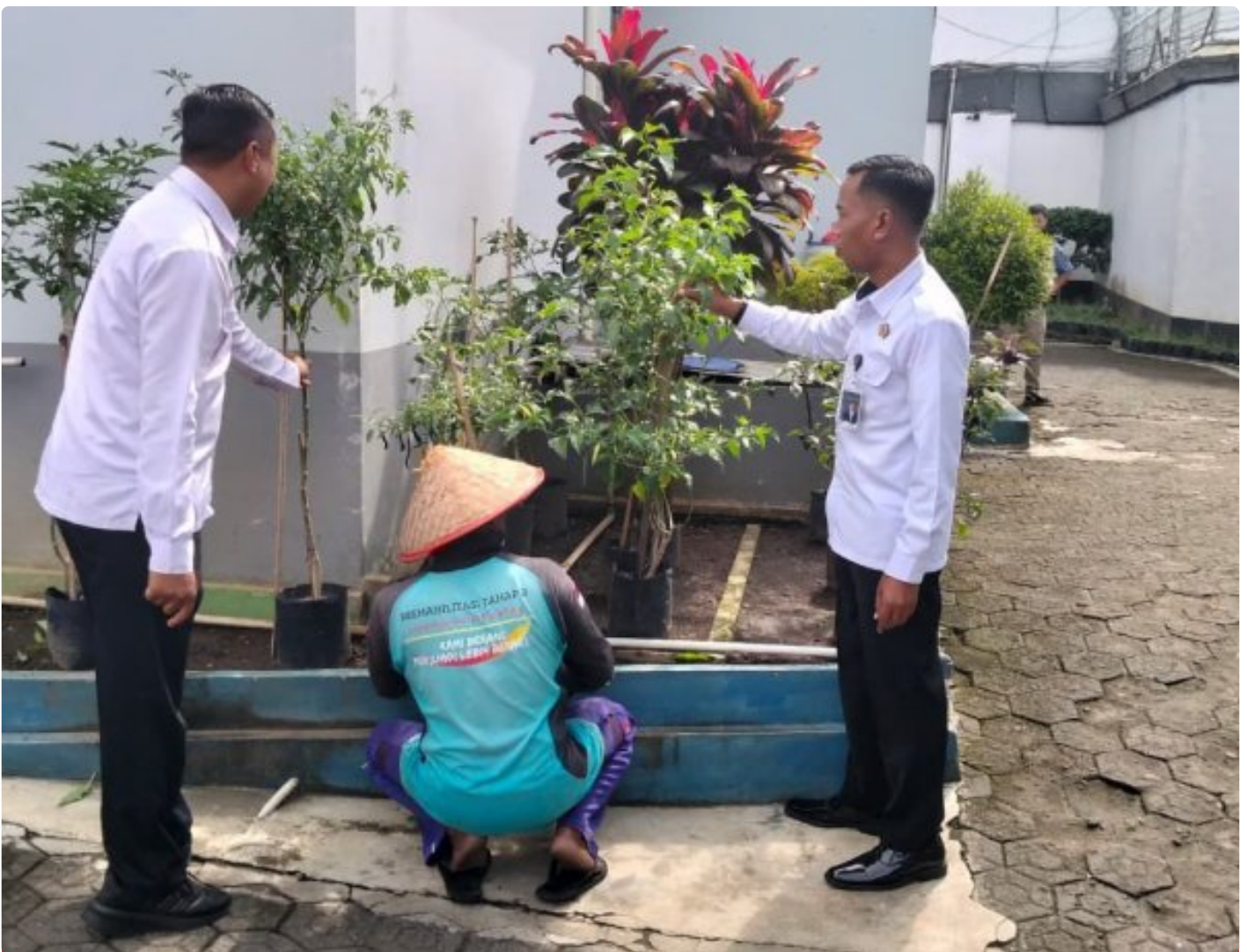
Perkuat Program Kemandirian, Kalapas Magelang Cek Perkembangan Tanaman Ketahanan Pangan

Magelang - Dalam upaya memperkuat program kemandirian dan mendukung peningkatan ketahanan pangan di lingkungan Lembaga Pemasyarakatan Kelas IIA Magelang, Senin (08/12/2025).