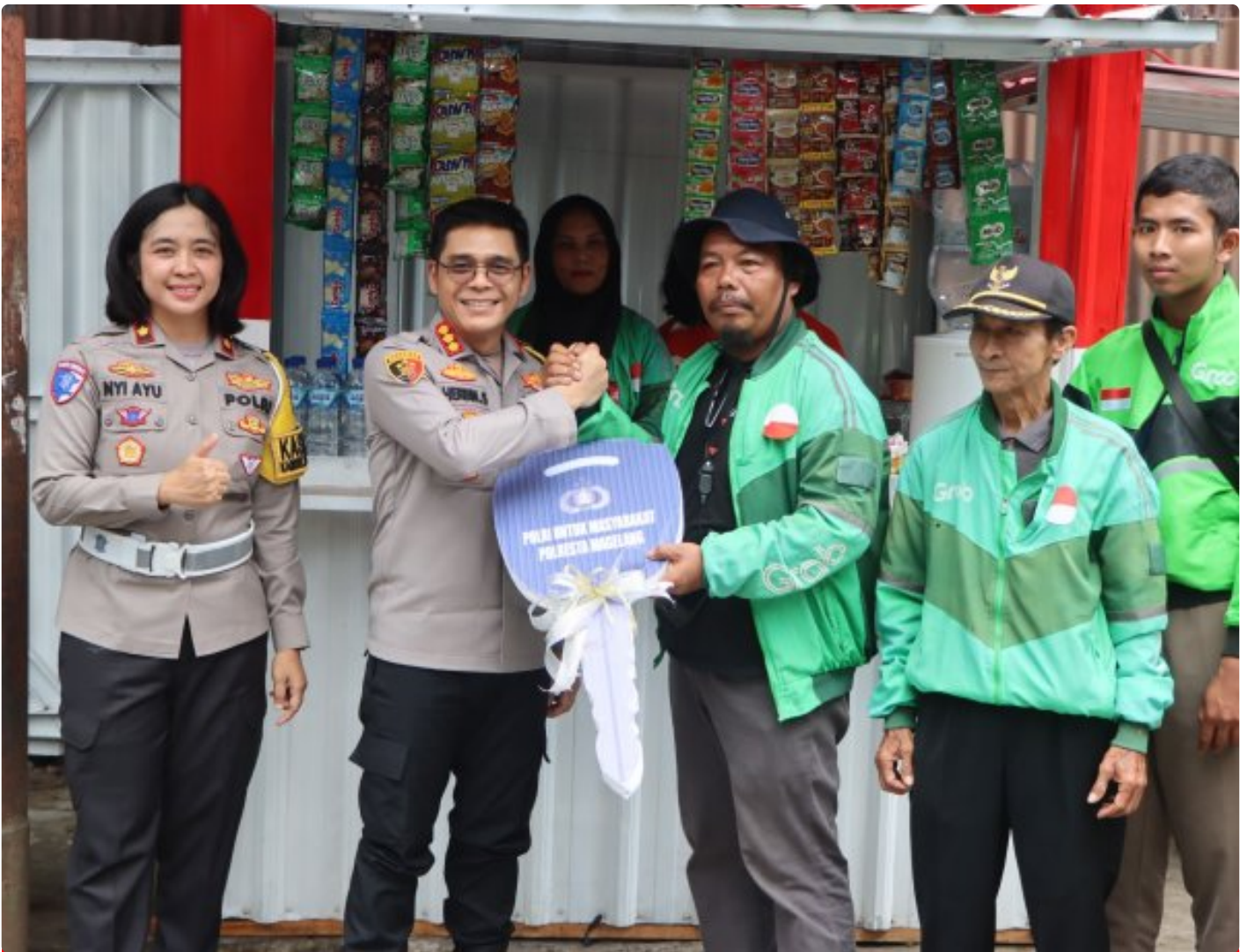
Foto: Saat Kapolresta Magelang, Kombes Pol Herbin Sianipar, S.I.K., S.H., meresmikan Ojol Kamtibmas Mart Borobudur, Jum'at (19/12/2025).

MAGELANG - Sebuah terobosan inovatif dalam menjaga keamanan dan ketertiban masyarakat (kamtibmas) di Magelang baru saja diresmikan. Polresta Magelang tidak hanya berupaya mendekatkan diri pada warga, tetapi juga merangkul elemen masyarakat yang paling dekat dengan denyut nadi aktivitas sehari-hari, yakni para pengemudi ojek online (ojol). Melalui inisiatif yang