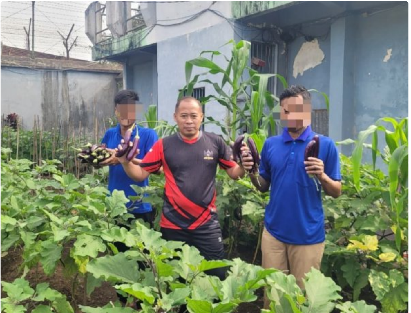
Lapas Magelang Sukses Panen Terong, Wujud Pembinaan Kemandirian Warga Binaan

MAGELANG – Lembaga Pemasyarakatan (Lapas) Kelas IIA Magelang kembali menunjukkan komitmennya dalam membina kemandirian warga binaan melalui kegiatan pertanian. Kali ini, Sabtu 13/12/2025 Lapas Magelang berhasil melaksanakan panen terong yang ditanam dan dirawat langsung oleh warga binaan sebagai bagian dari program pembinaan kemandirian.