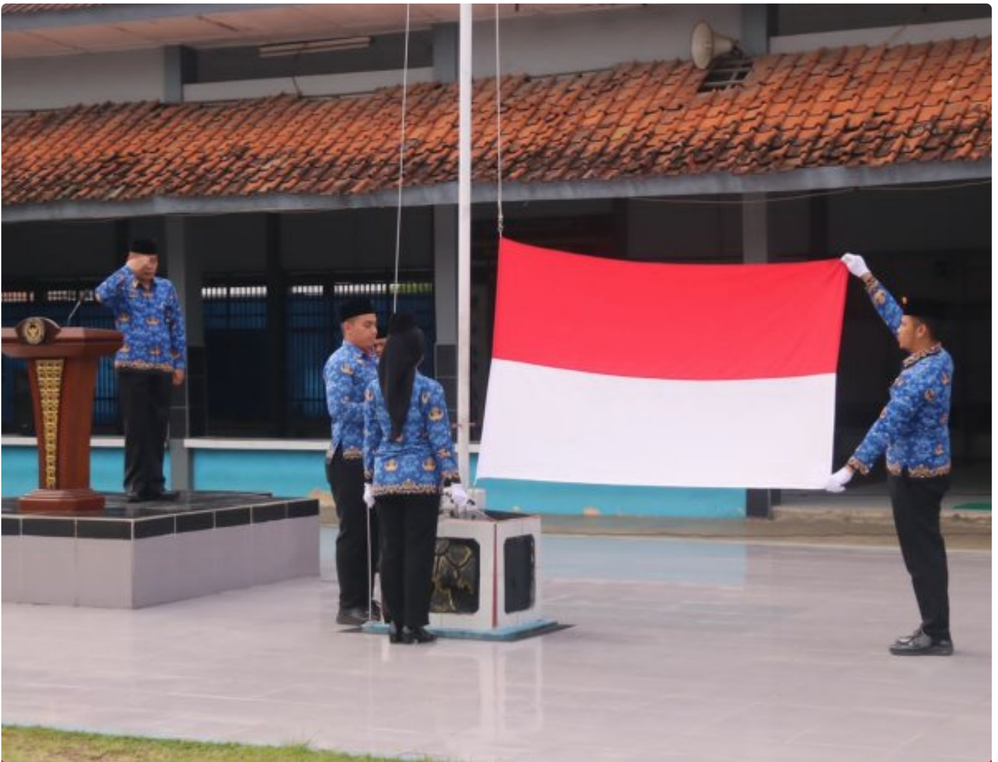
Lapas Magelang Semarakan HUT Korpri ke-54 dengan Upacara Penuh Integritas

Magelang — Lembaga Pemasyarakatan (Lapas) Kelas IIA Magelang menyemarakkan peringatan Hari Ulang Tahun Korps Pegawai Republik Indonesia (HUT Korpri) ke-54 dengan menggelar upacara penuh integritas, pada Senin (01/12/2025).