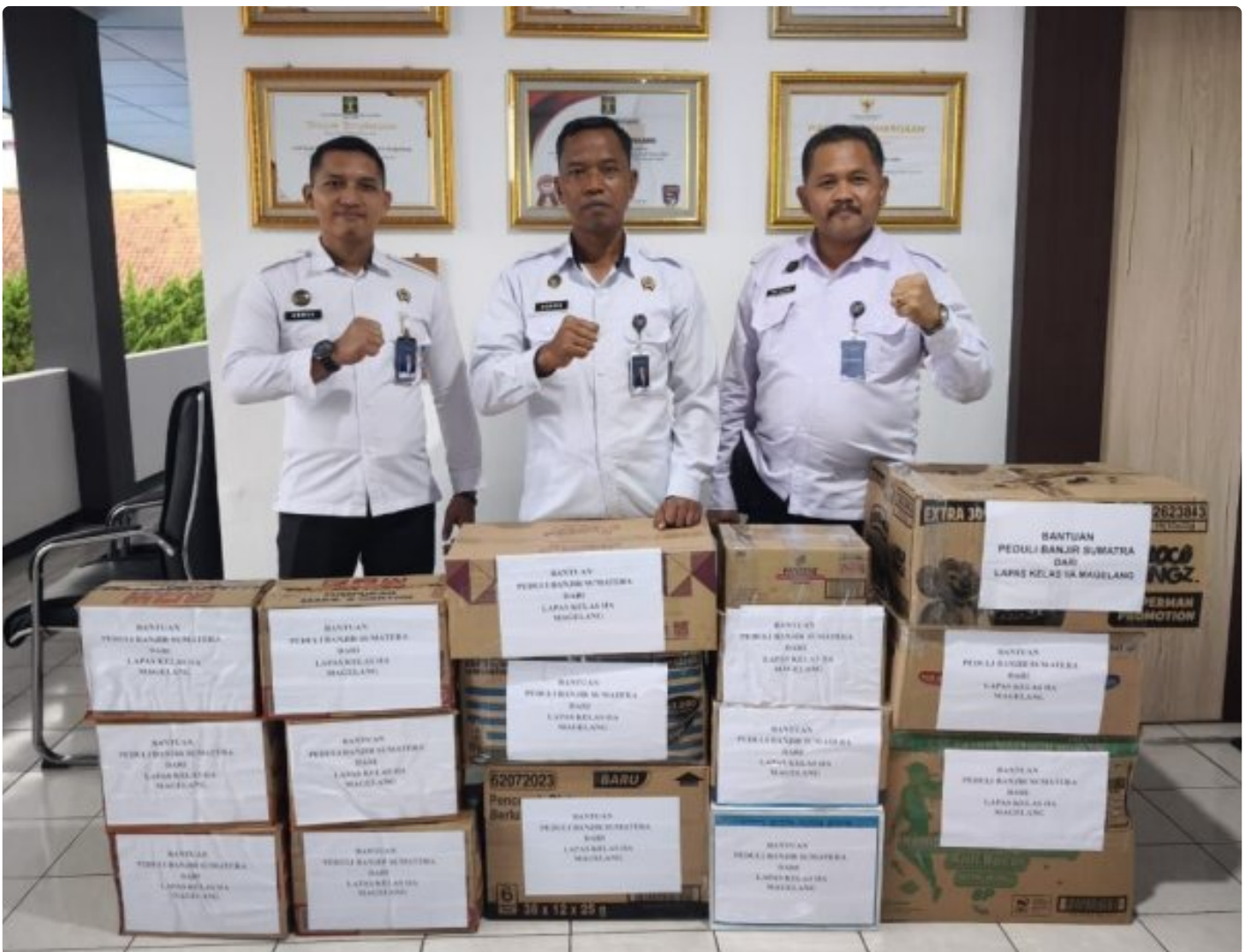
Lapas Magelang Salurkan Bantuan Logistik untuk Korban Banjir Sumatera Barat

Magelang - Lembaga Pemasyarakatan (Lapas) Kelas IIA Magelang menunjukkan kepedulian terhadap para korban banjir yang melanda wilayah Sumatera Barat dengan menyalurkan bantuan logistik pada Kamis 11/12/2025.