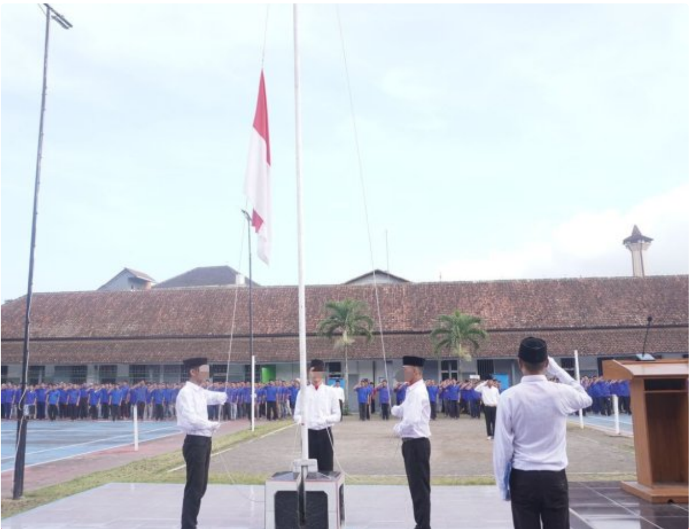
Lapas Magelang Perkuat Pembinaan Kepribadian WBP melalui Upacara Kesadaran Berbangsa dan Bernegara

Magelang — Lembaga Pemasyarakatan (Lapas) Magelang terus memperkuat pembinaan kepribadian Warga Binaan Pemasyarakatan (WBP) melalui pelaksanaan Upacara Kesadaran Berbangsa dan Bernegara, Rabu 17/12/2025.