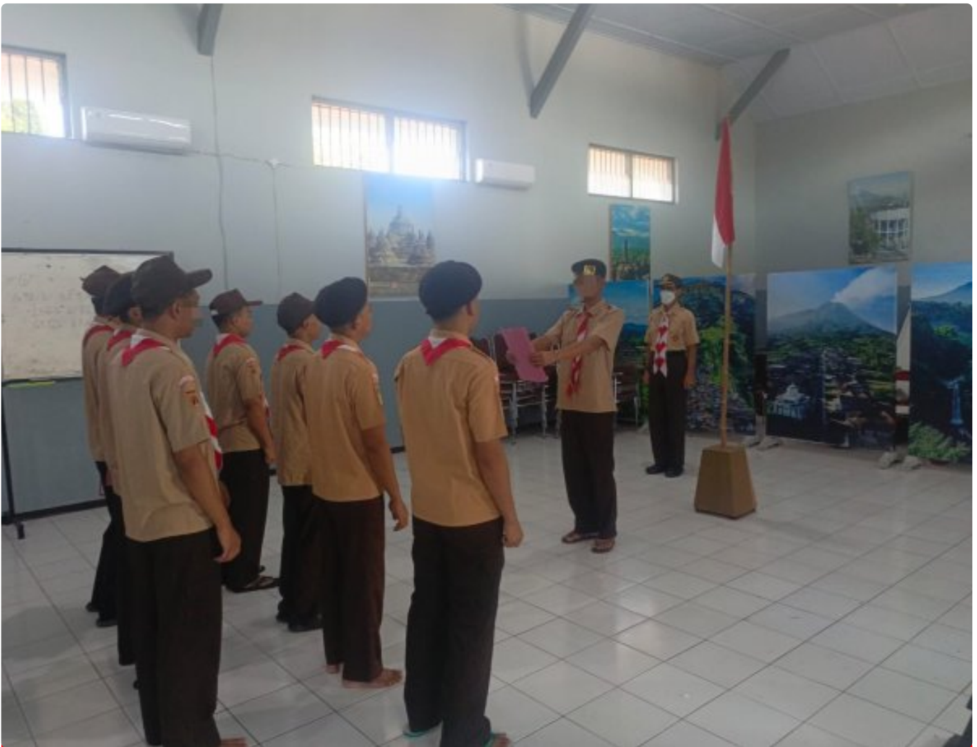
Lapas Magelang Perkuat Kesadaran Berbangsa WBP Melalui Pembinaan Pramuka

Magelang - Pembinaan kepribadian kesadaran berbangsa melalui kegiatan kepramukaan berupa Peraturan Baris Berbaris (PBB) dilaksanakan di Lembaga Pemasyarakatan Kelas IIA Magelang pada Jumat, 12/12/2025.