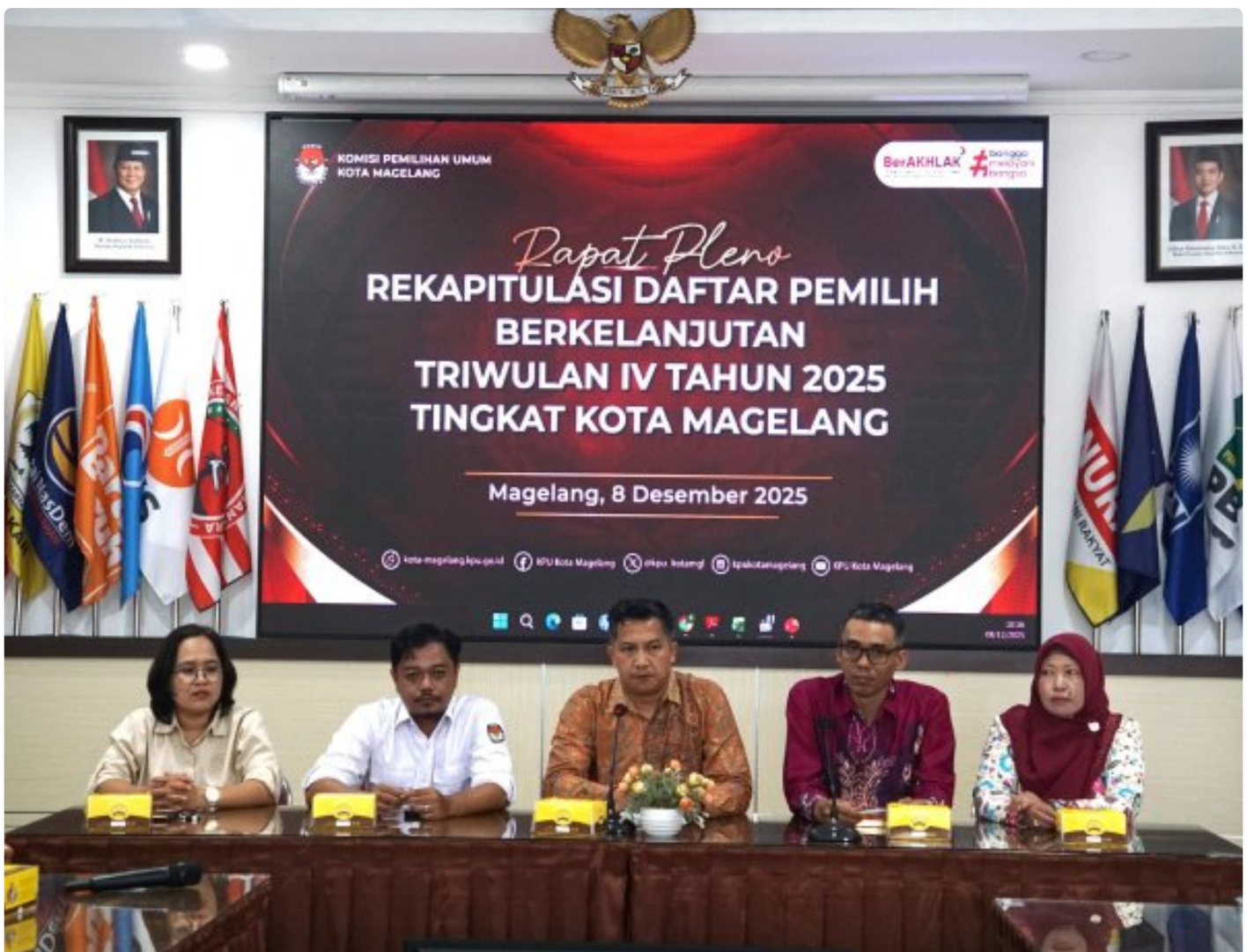
Lapas Magelang hadiri Pleno Rekapitulasi Daftar Pemilih Berkelanjutan di KPU Kota Magelang

Magelang - Lembaga Pemasyarakatan (Lapas) Kelas IIA Magelang menghadiri sidang pleno rekapitulasi Daftar Pemilih Berkelanjutan (DPB) Triwulan IV Tahun 2025 yang digelar oleh Komisi Pemilihan Umum (KPU) Kota Magelang. Senin (08/12/2025).Lapas Magelang diwakili oleh Kasubsi Registrasi, yang hadir untuk