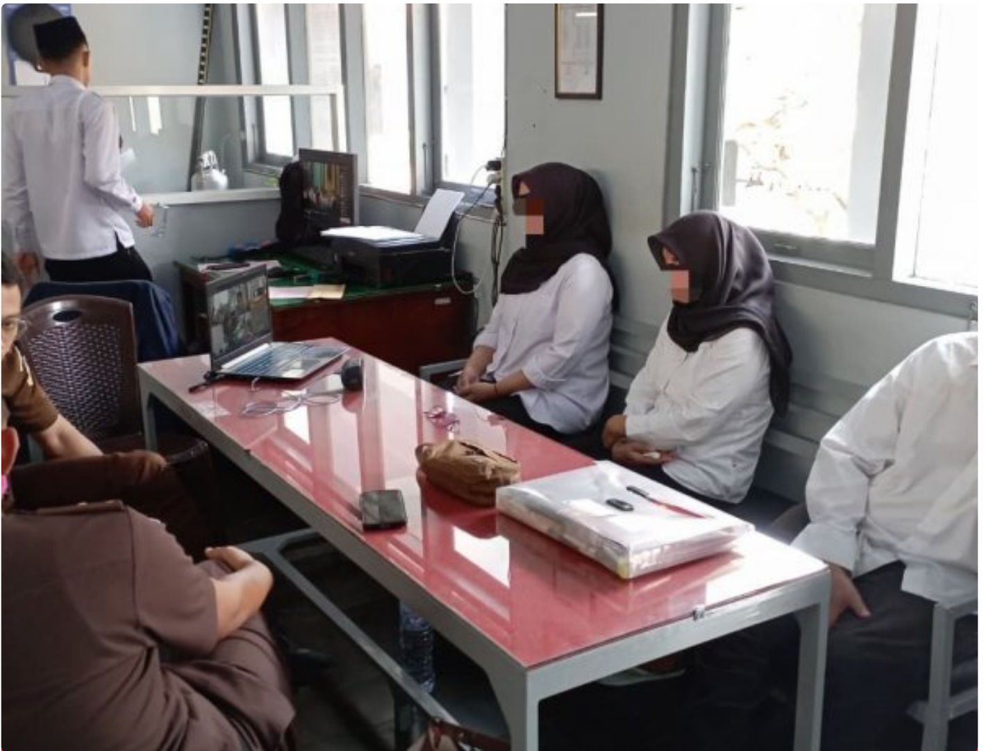
Lapas Magelang Fasilitas pelaksanaan Sidang Daring dengan WBP sebagai Saksi

Magelang – Lembaga Pemasyarakatan (Lapas) Kelas IIA Magelang memfasilitasi pelaksanaan sidang secara daring (online) dalam perkara tindak pidana korupsi (tipikor) dengan menghadirkan Warga Binaan Pemasyarakatan (WBP) sebagai saksi. Kegiatan tersebut dilaksanakan atas permintaan aparat penegak hukum dan bertempat di ruang telekonferensi Lapas Kelas IIA Magelang, Selasa 16/12/2025.