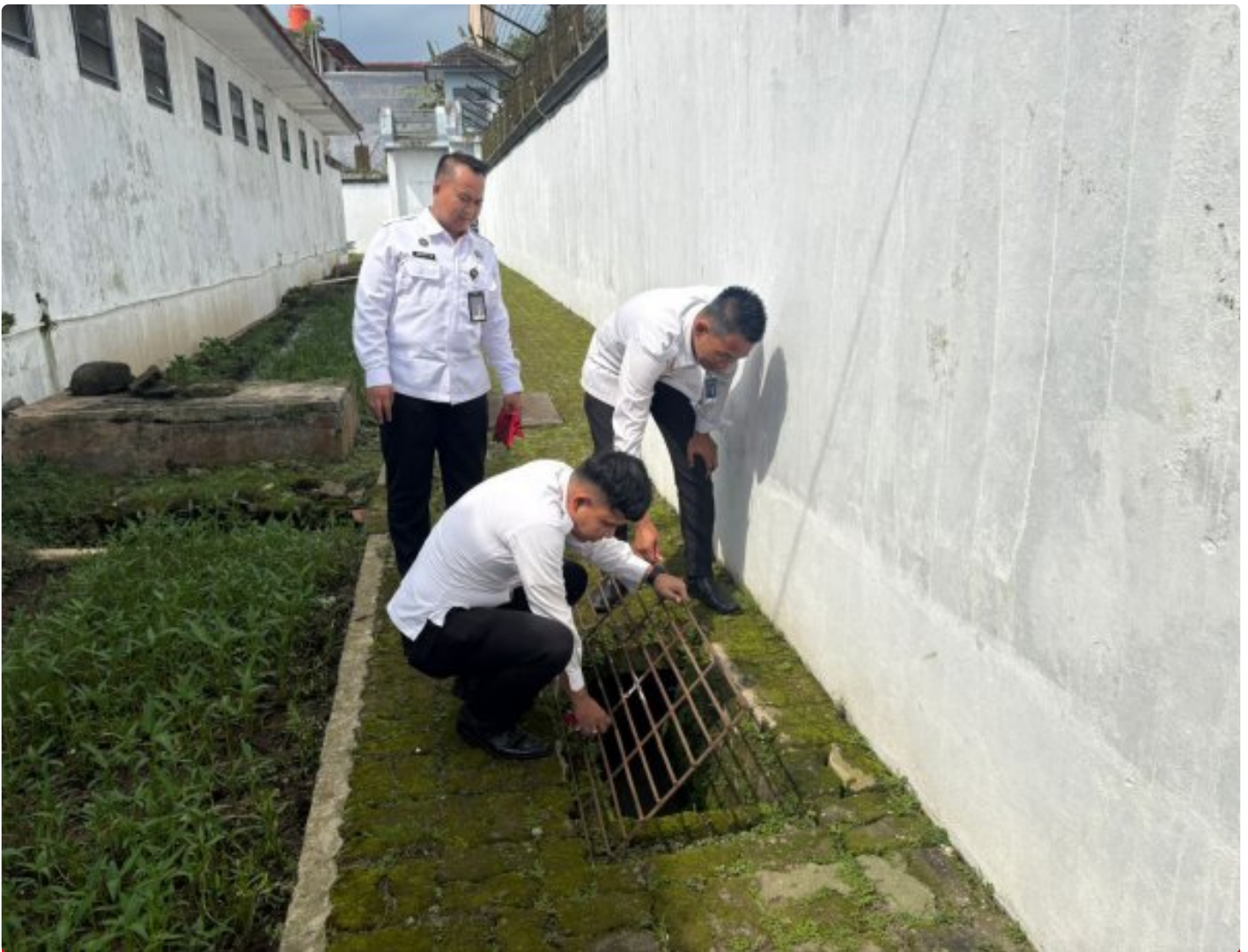
Kesiapsiagaan ditingkatkan, Sie Kamtib Lapas Magelang Intensifkan Deteksi Dini

Magelang - Lapas Kelas IIA Magelang terus menunjukkan komitmennya dalam menjaga stabilitas keamanan dan ketertiban. Melalui Seksi Keamanan dan Tata Tertib (Sie Kamtib), Selasa (02/12/2025). Berbagai langkah penguatan pengawasan kembali diintensifkan, terutama melalui kegiatan deteksi dini yang digelar secara rutin dan terukur.