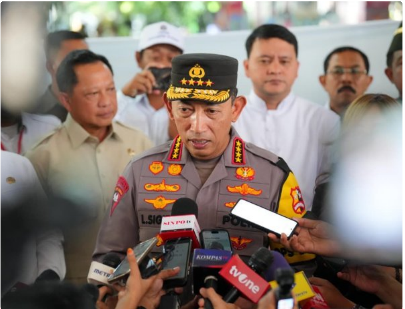
Kapolri Jenderal Listyo Sigit Prabowo

JAKARTA- Suasana khidmat menyelimuti Gereja Katedral dan GPIB Immanuel di Jakarta Pusat pada Rabu (24/12/2025). Di tengah persiapan menyambut malam Natal, kehadiran Kapolri Jenderal Listyo Sigit Prabowo memberikan jaminan ketenangan bagi umat yang akan beribadah.