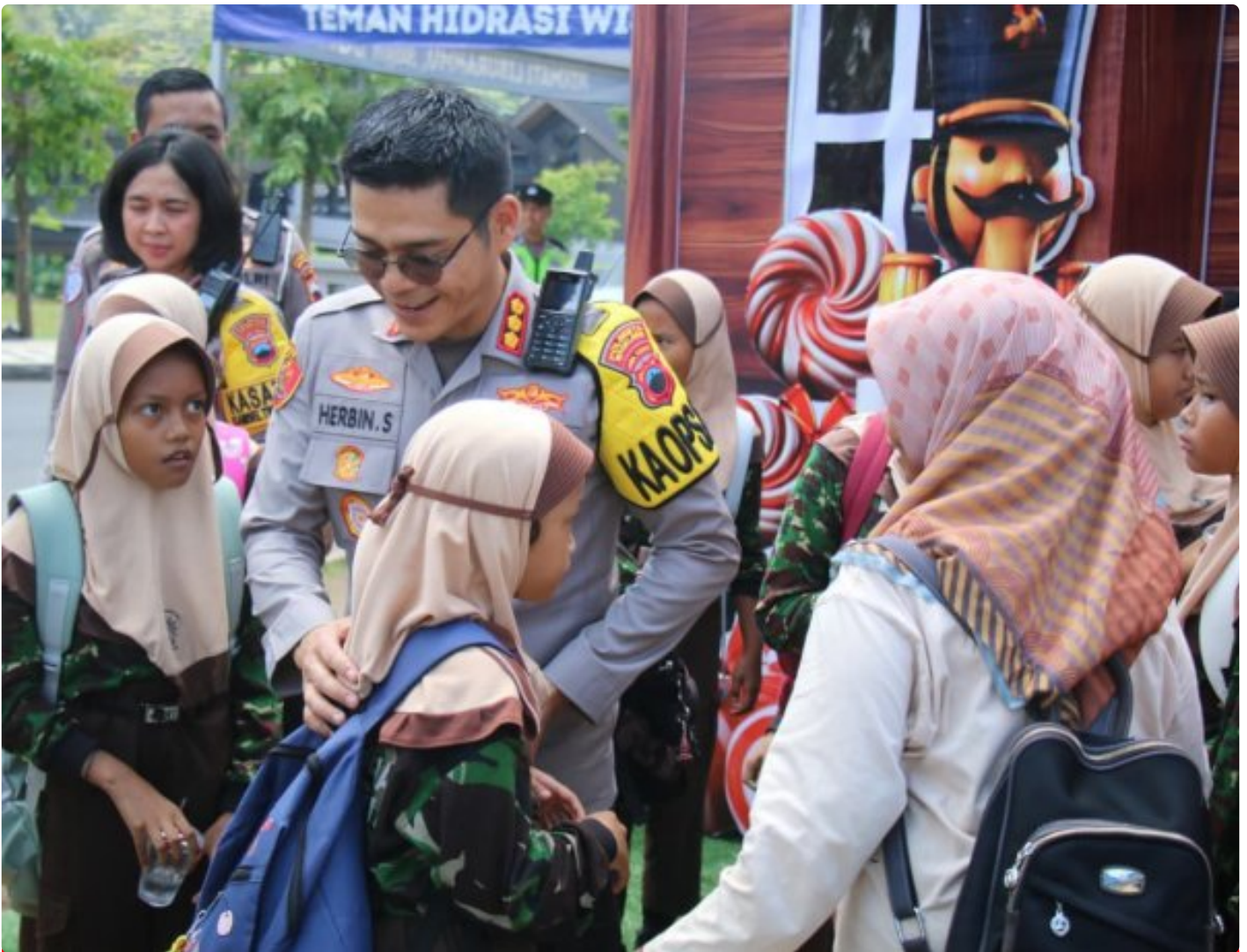
Foto: Sosok Profil Kapolresta Magelang, Kombes Pol Herbin Sianipar, S.I.K., S.H, Sabtu (20/12/2025).

MAGELANG - Menjelang puncak perayaan Natal 2025 dan pergantian tahun, Kapolresta Magelang , Kombes Pol Herbin Sianipar, S.I.K., S.H., menunjukkan komitmennya dalam memastikan keamanan dan kenyamanan masyarakat. Kehadirannya di lapangan bukan sekadar formalitas, melainkan wujud nyata keseriusan dalam menjaga ketenangan.