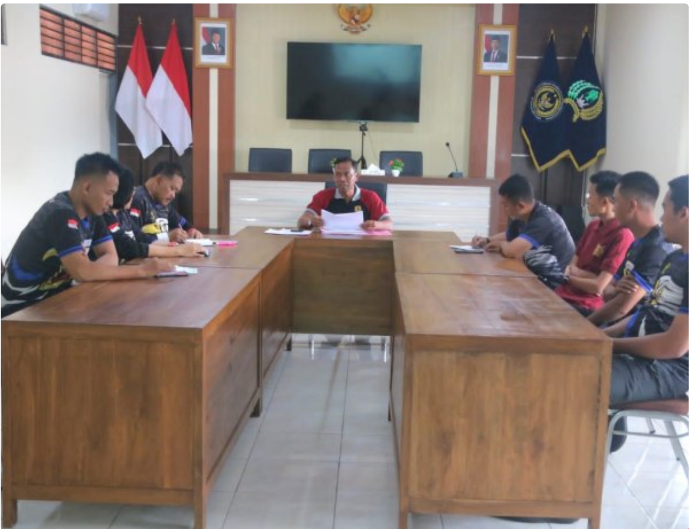
Kalapas Magelang Pimpin Rapat Persiapan Penyediaan Bama Bagi Warga Binaan Tahun 2026

Magelang - Kepala Lembaga Pemasyarakatan (Kalapas) Kelas IIA Magelang memimpin langsung rapat persiapan penyediaan Bahan Makanan (Bama) untuk warga binaan pada tahun anggaran 2026, Sabtu (29/11/2025).