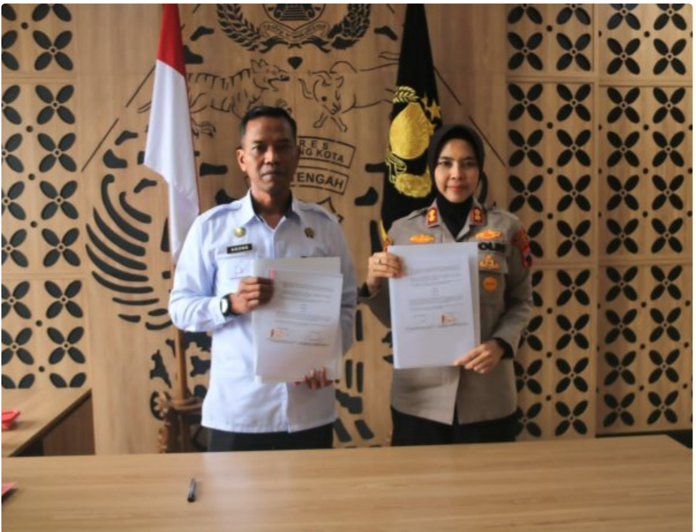
Kalapas Magelang dan Kapolres Magelang Kota Tanda Tangan PKS Sinergitas Kedua APH

Magelang – Kepala Lembaga Pemasyarakatan (Kalapas) Kelas IIA Magelang bersama Kapolres Magelang Kota resmi menandatangani Perjanjian Kerja Sama (PKS) tentang sinergitas pelaksanaan tugas dan fungsi antara kedua Aparat Penegak Hukum (APH), bertempat di Polres Magelang Kota, Kamis 18/12/2025.