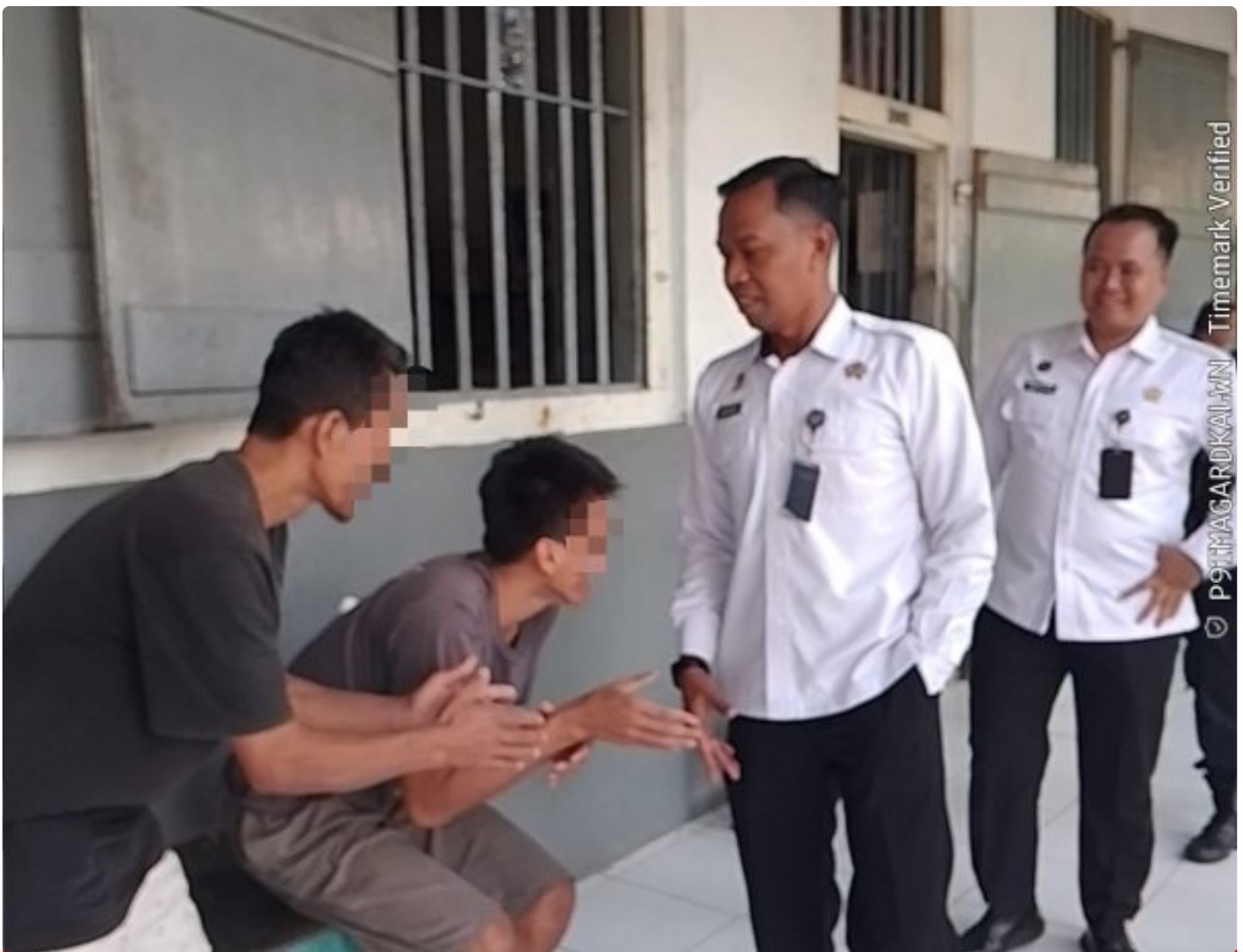
Jaga Stabilitas Lapas, Kalapas Intensifkan Kontrol Blok Hunian

Magelang - Dalam upaya menjaga stabilitas keamanan dan ketertiban di lingkungan Lembaga Pemasyarakatan, Kepala Lapas (Kalapas) mengintensifkan kegiatan kontrol langsung ke blok hunian warga binaan Selasa (16/12/2025).