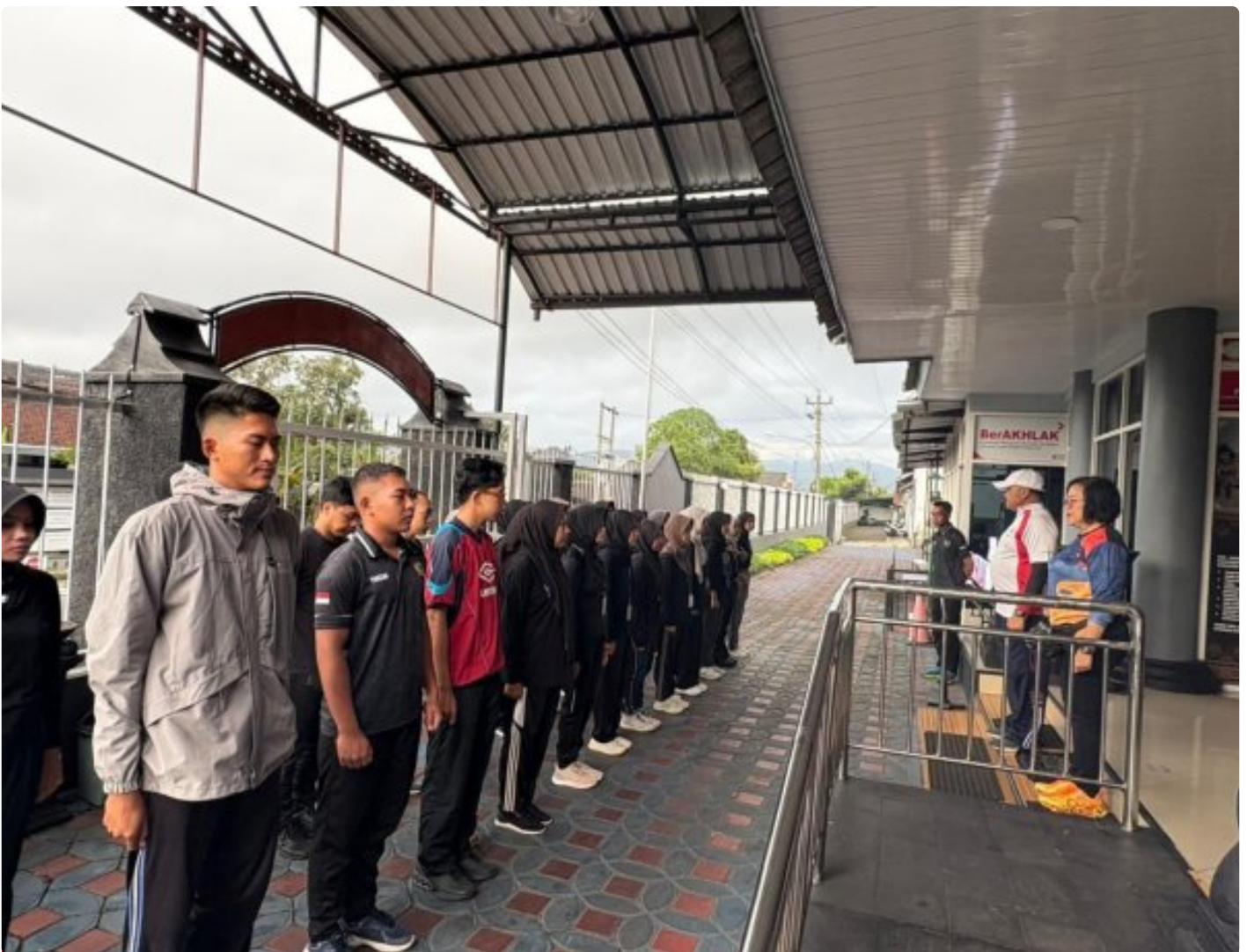
Energi Positif Pagi Hari, Peserta Magang Lapas Magelang Laksanakan Gerak Jalan Bersama

Magelang - Lapas Kelas IIA Magelang mengawali hari dengan suasana penuh semangat saat para peserta Magang Nasional melaksanakan kegiatan gerak jalan pagi bersama, Jumat 12/12/2025.