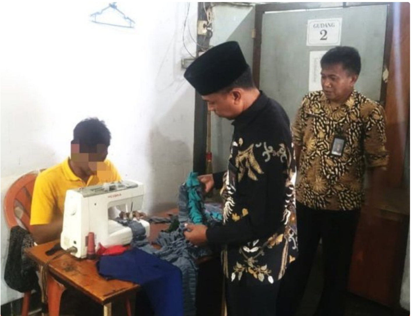
Dukung Kreativitas WBP, Kalapas Magelang Dampingi Pembuatan Kaset Kain Perca

Magelang - Kalapas Magelang memberikan dukungan penuh terhadap pengembangan kreativitas Warga Binaan Pemasyarakatan (WBP) dengan mendampingi langsung kegiatan pembuatan kaset dari kain perca, Jumat (26/12/2025).