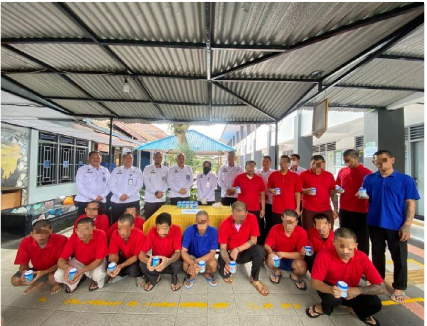
Cegah Peredaran Gelap Narkoba, Lapas Magelang Tes Urin Seluruh WBP

Magelang — Dalam upaya memperkuat pencegahan peredaran gelap narkoba di lingkungan masyarakat, Lembaga Masyarakat (Lapas) Kelas IIA Magelang melaksanakan tes urin kepada seluruh Warga Binaan Masyarakat (WBP), pada Rabu, (03/12/2025).