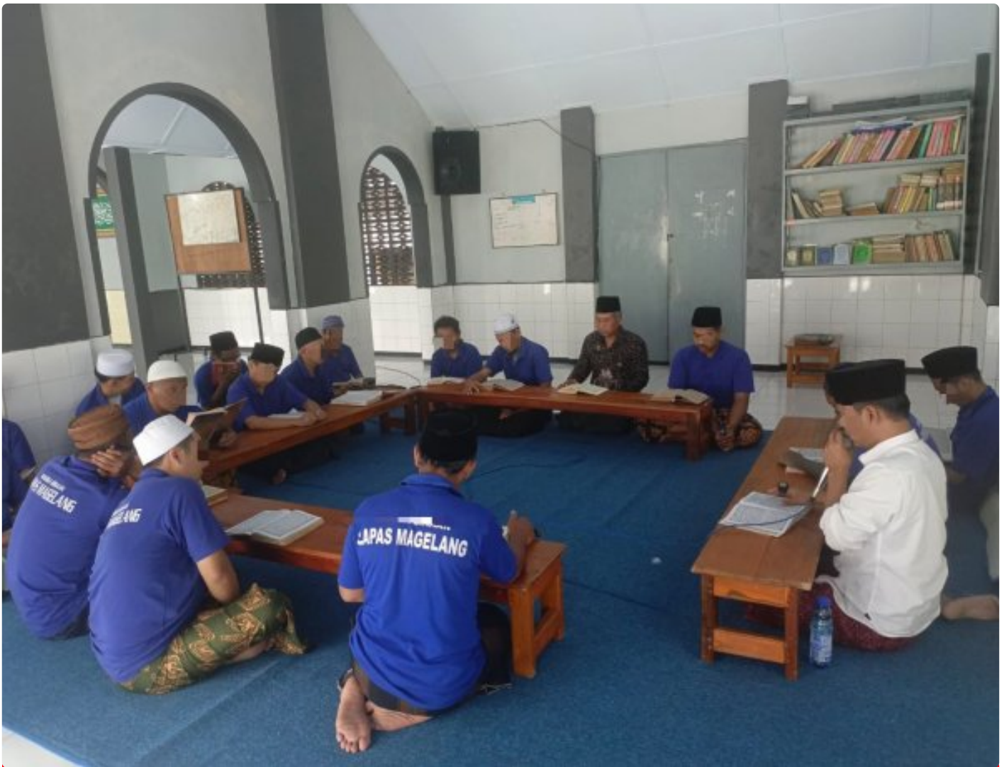
Bangun Akhlak melalui One Day One Juz di Lapas Magelang

Magelang – Kamis, 04/12/2025 Lembaga Pemasyarakatan Kelas IIA Magelang terus meningkatkan program pembinaan kepribadian bagi Warga Binaan Pemasyarakatan (WBP) melalui kegiatan keagamaan, Kamis (04/12/2025).